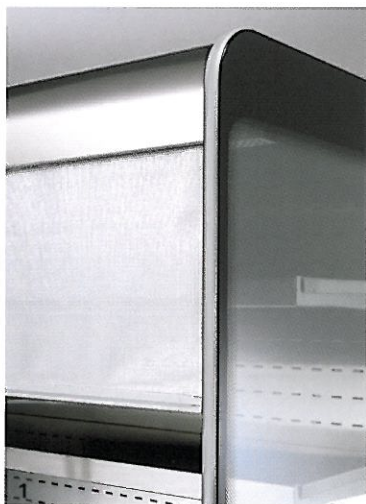
1 Particolare della tendina di chiusura, auto-avvolgente. Detail of the automatic pull-down shade.